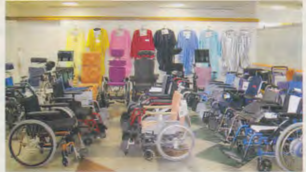
※学校の授業や事業所の研修などをご遠慮ください。